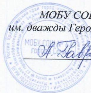
График работы кружка «Театральная мастерская» на 2023 – 2024 учебный год