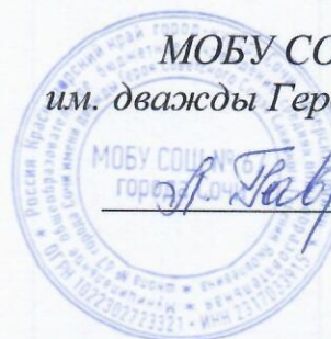
График работы кружка «Умелые ручки» на 2023 – 2024 учебный год